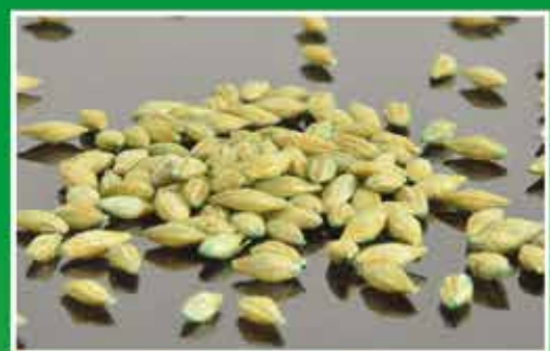
Mit Smart-Seed behandeltes Gerstensaatgut