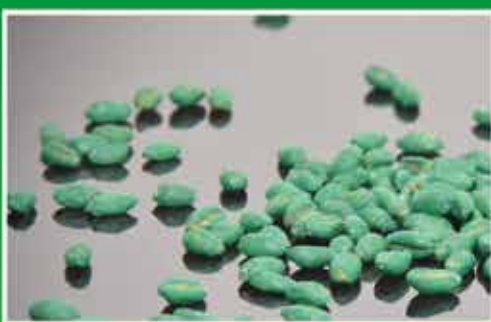
Mit Smart-Seed behandeltes Weizensaatgut